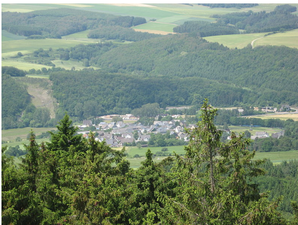
Vista de Gehlweiler, a partir do castelo de Koppestein

Gehlweiler conta, de acordo com estatísticas oficiais, com cerca de 254 habitantes e tem uma área de 450 hectares, dos quais 249 hectares em áreas florestais.